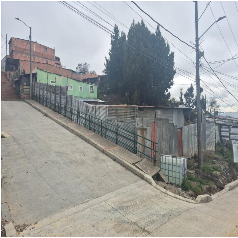
IMAGEN 3: FACHADA LATERAL