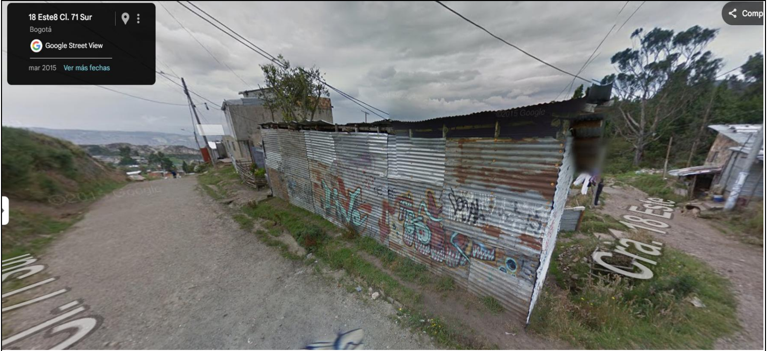
IMAGEN 1: NOMENCLATURA